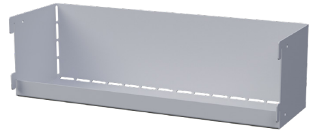
Pryllåda Monteras på insida dörr