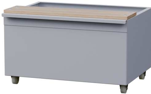
Sittbänk med utdragbar låda För placering under skåp