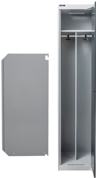
Svängbar eller fast skiljevägg Monteras under hatthylla i skåp