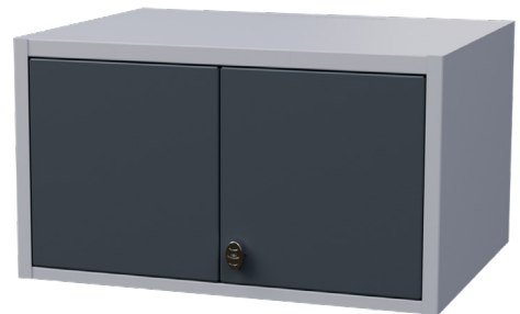
Överskåp För placering ovanpå skåp

Utöver dessa tillbehör går det även att beställa mekanisk ventilation till ditt skåp.